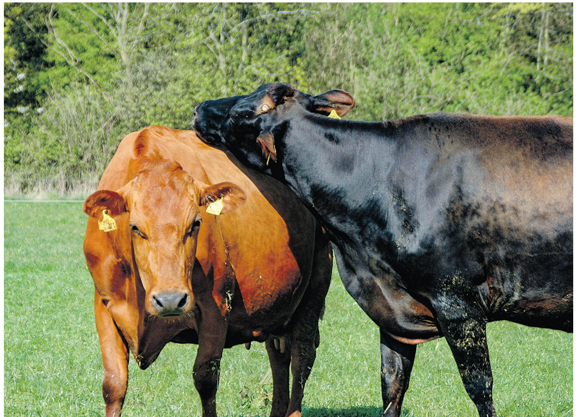
Køers sociale adfærd er et af flere områder, man kan have fokus på, når man arbejder med øget dyrevelfærd.

- Vi har allerede kontrolsystemer og en hær af rådgivere, der støtter op om den målbare dyrevelfærd, det vil sige et minimum af sygdom og død, god smittebeskyttelse, lavt celletal, optimeret foder, lys, luft og gode lejer. Når dét er på plads, kan man udfordre sig selv på robusthed og naturlighed. Det kræver mere dialog og langsigtede løsninger, som man ikke altid kan måle den direkte effekt af, men som omgivelserne anerkender, når de køber den økologiske mælk og ost. Hvis vi fortsat vil have merpris for varen, skal vi blive ved med at udfordre de daglige rutiner og sætte ord på, hvordan økologien leverer ekstraordinær god dyrevelfærd, understreger hun.