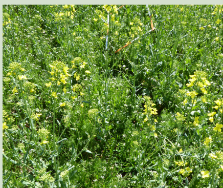
Ukrudt som agersennep kan udkonkurrere raps hvis betingelserne tillader det.

Anbefalet rækkeafstand er op til 50 cm så der er mulighed for at radrense. Med kløvergræs som forfrugt og lavt ukrudtstryk anbefales 12,5 cm.