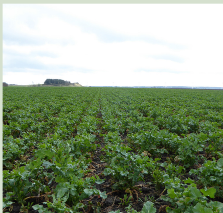
En vejetableret rapsmark.