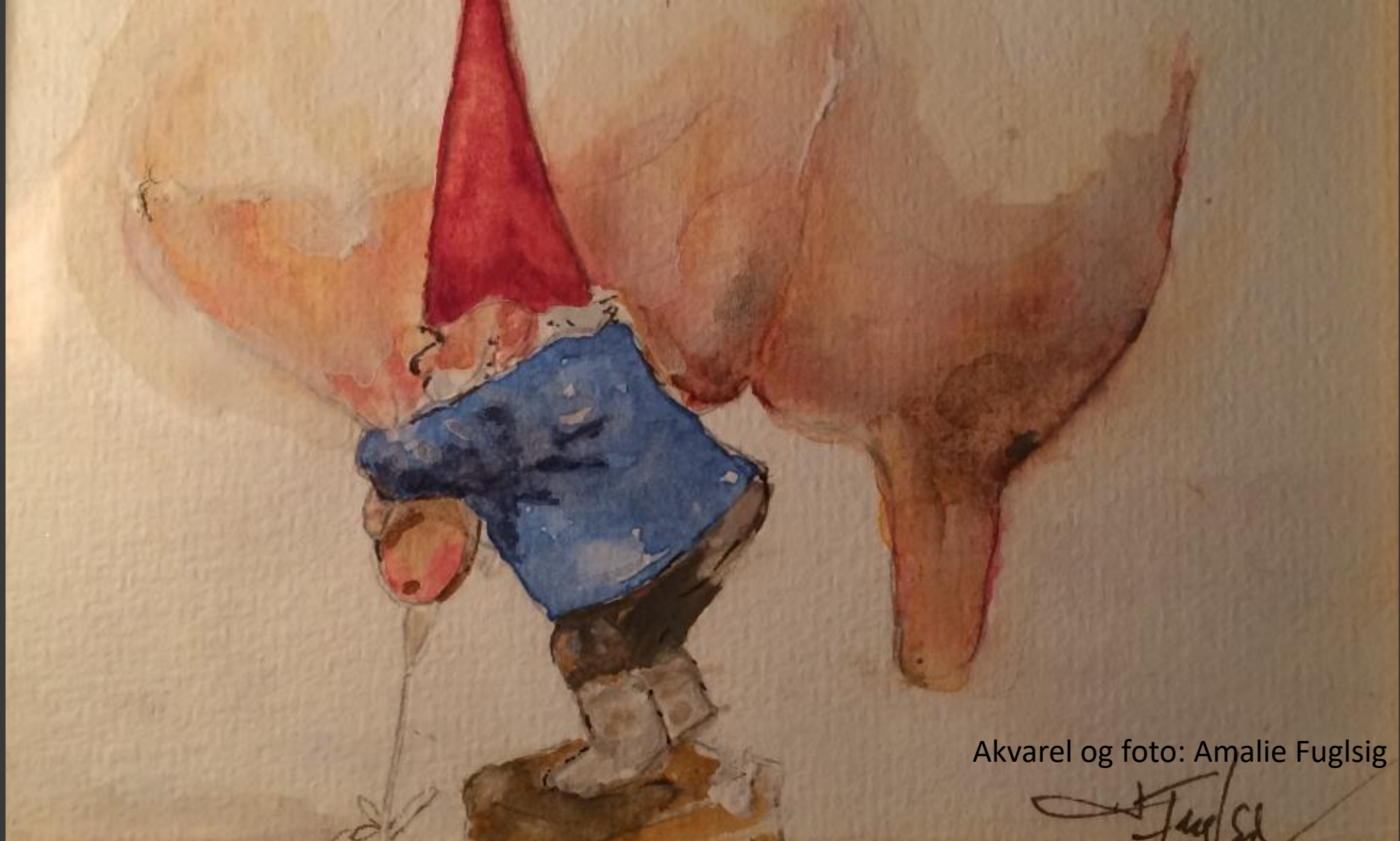
Akvarel og foto: Amalie Fuglsig